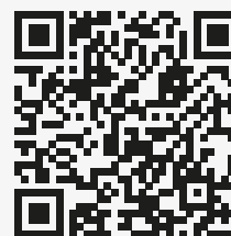
QR platba zálohy

Datum splatnosti je termín připsání platby na účet. Doporučujeme Vám proto zadat platbu s dostatečným předstihem.